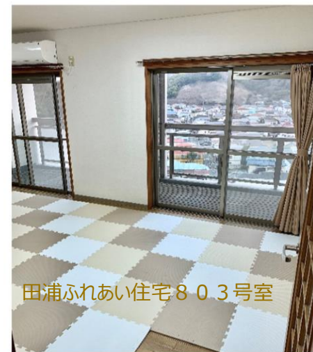
田浦ふれあい住宅803号室